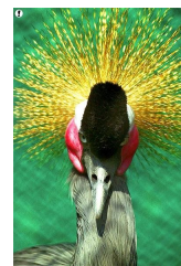
35 ראה לעיל הערת שוליים 11.